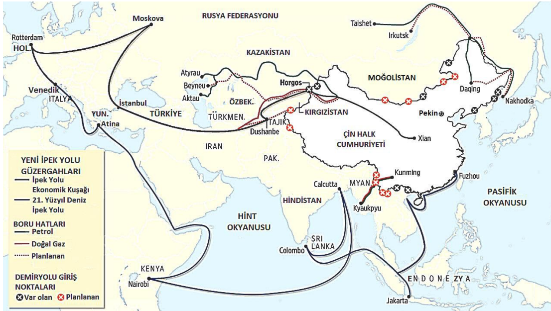
Şekil 1- 1

İpek Yolu Projesi kapsamında kara ve deniz yolu olarak iki farklı hattın oluşturulması planlanmaktadır (Şekil 1-1). Birincisi “İpek Yolu Ekonomik Kuşağı” (Silk Road Economic Belt) diye adlandırılan kara hattı olup, Çin’den Avrupa’ya kadar olan ülkeleri birbirine bağlar. “Proje kapsamında yüksek hızlı demir yolu, kara yolu, limanlar, havaalanları, doğalgaz hatları ve diğer altyapı projeleri yer almaktadır.” (MCBRIDE, 2015)