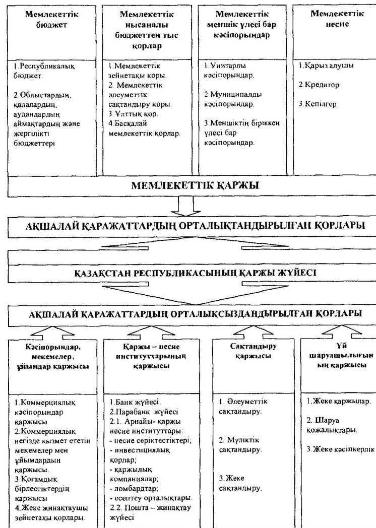
1-сурет. ҚР қаржы жүйесінің құрылым нұсқалары сипатталаған. Ескерту: автормен құрастырылған.

есебінен өтеледі. Қаржы категориясы ретінде мемлекеттік бюджет қайтарымдылық, төлемділік белгілеріне ие, бірақ қаржы категориясы болып табылмайтын банк несиесінен ерекшеленеді.